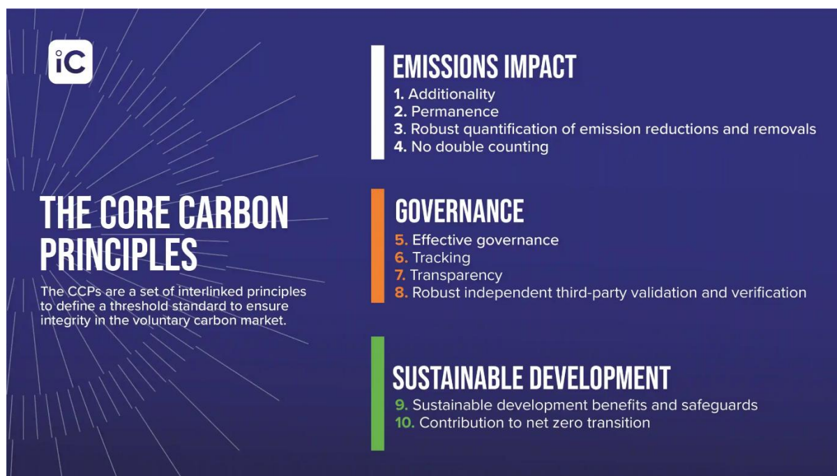
Figure 2 : Les 10 Core Carbon Principles de l'ICVCM